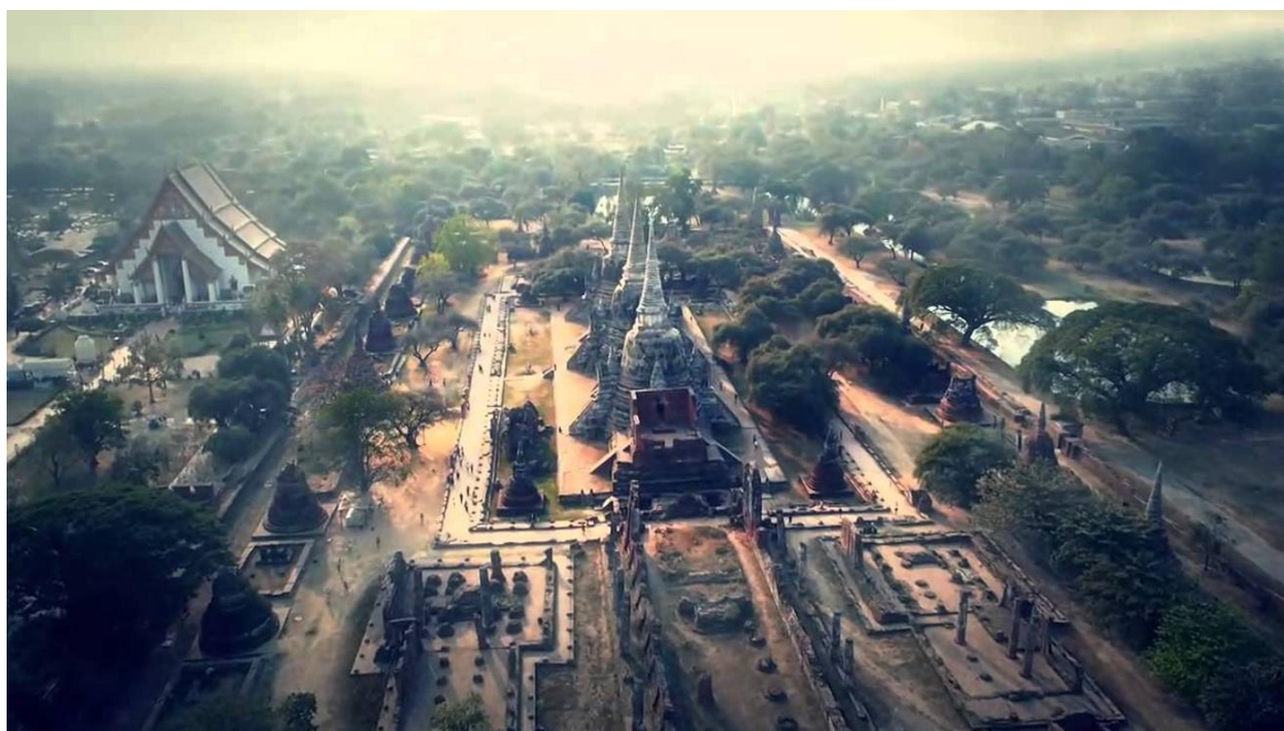
อยุธยา Bird's Eye View มอญมใหม่ (๒๕๕๗). www.youtube.com/watch?v=do๕wnZimZKU

เรือนไทยสถาบันอยุธยาศึกษา สร้างแล้วเสร็จและย้ายสำนักงานมาอยู่ที่แห่งนี้เมื่อ พ.ศ.๒๕๔๙ โดยมีการแบ่งการใช้งานของเรือนไทยและบริเวณโดยรอบคือ ชั้นล่างเป็นสำนักงาน ห้องประชุม ศูนย์ข้อมูลอยุธยาศึกษา โถงนิทรรศการ หมุนเวียน ส่วนบริเวณชั้น ๒ จัดแสดงนิทรรศการถาวรในอาคารเรือนไทย ๓ หลัง เรือนไทยแห่งนี้จึงเป็นแหล่งเรียนรู้ทางประวัติศาสตร์ วัฒนธรรมและภูมิปัญญาท้องถิ่น แก่นักเรียน นักศึกษาและผู้สนใจทั่วไป โดยตั้งโดดเด่นอยู่ริมถนนปรีดีพินมยงค์ ภายใต้อชื่อ “สถาบันอยุธยาศึกษา”