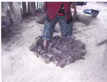
3. เหยียบดิน : ทราयीให้เข้ากัน