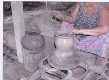
5. ทำปากหม้อ