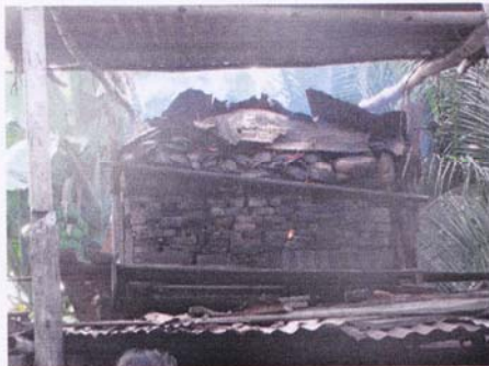
7. ค่อยๆ เร่งความร้อนให้สูงขึ้นทีละน้อย จนพื้นที่บรรจุในเตาถูกไหม้จนถึงจอมเตา