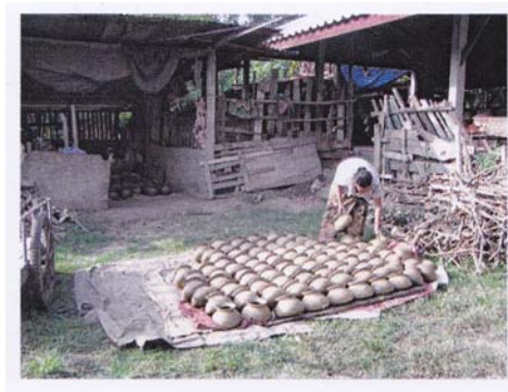
3. หม้อที่ขัดแล้ว เตรียมนำเข้าเตาเผา ให้ผึ่งแดดก่อน