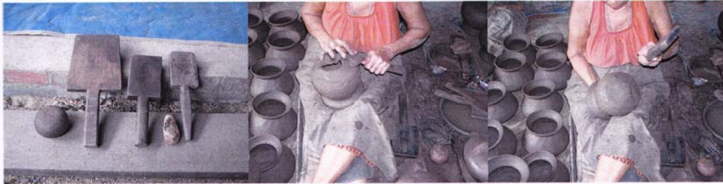
1. ไม้ลายตกแต่งรูปหม้อ

1.3 วิธีการแต่งหม้อหุ่่น อุปกรณ์ที่ใช้ในการแต่งหม้อหุ่่นมีไม้ลาย ลูกหิน อุปกรณ์ สำหรับตกแต่งรูปหม้อ และกระทู้กั้นหม้อ ไม้สำหรับตกแต่งรูปทรงเรียกไม้ลายหรือชาวบ้านจะเรียกว่า “ลาย” สำหรับตกแต่งก้นหม้อ จากนั้นจะตีด้วย “ลายละ” (ขนาดไม้จะหนากว่าลายเต็ม) แล้วจึงตกแต่งด้วย “ลายเต็ม” (ขนาดลายจะบายกว่าลาย ละ) ตามขั้นตอนภาพที่ 3