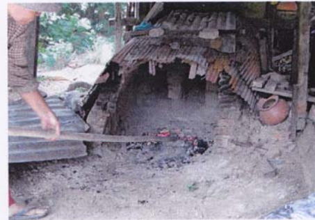
6. ใส่พื้นหน้าเตา