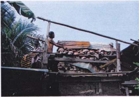
5. ปิดจอมเตาด้วยสังกะสีเพื่อให้ระอุ