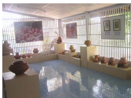
ชุดภาพประกอบพิพิธภัณฑ์เครื่องปั้นดินเผา