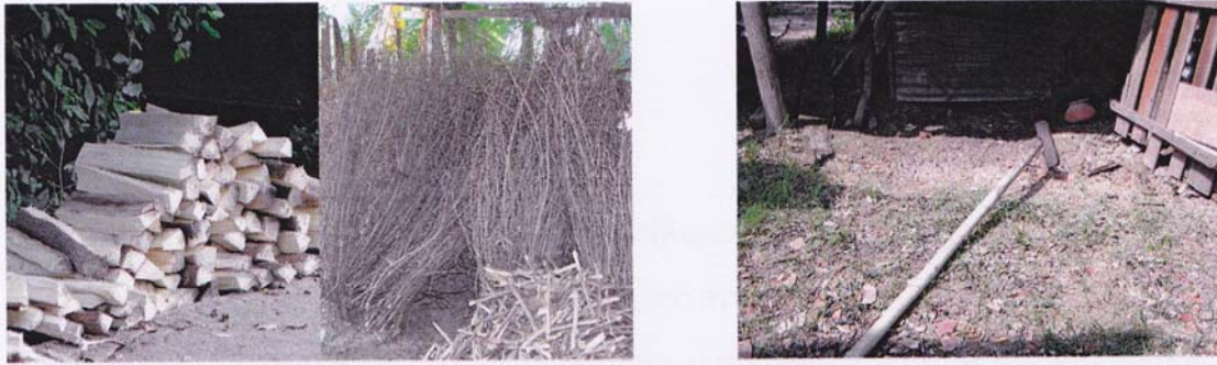
1. พื้นสำหรับใส่เตา – กำฝอย

กิ่งไม้สะแกเล็กๆ นำมาทำรวมกันชาวบ้านจะเรียก “กำฝอย” เพื่อใช้สำหรับใส่เตาขณะใส่เตาต้องมีอุปกรณ์ช่วยเจียพื้น ชาวบ้านเรียกอุปกรณ์นี้ว่า “ไม้คทา” เป็นไม้ไผ่ ปลายไม้ไผ่มีไม้พาดขวางใช้สำหรับดัน – เจียพื้น ดูภาพ 6 ประกอบ