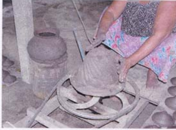
3. โปกช่อหรือโพนดิน