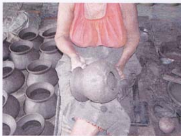
6. หม้อหุ่่น