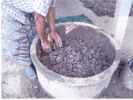
1. ดินที่มีความแข็งให้หมักในบ่อทิ้งไว้ 1 คืน