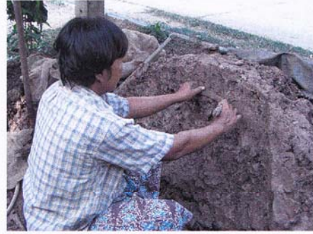
2. จะดินเป็นการแยกกรวดสิ่งปนออกมา