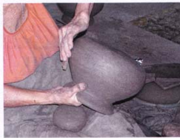
4. การตีเต็ม