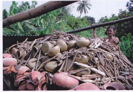
4. เรียงเต็มเตาเผาจนถึงจอมเตา (บนสุดของเตา)