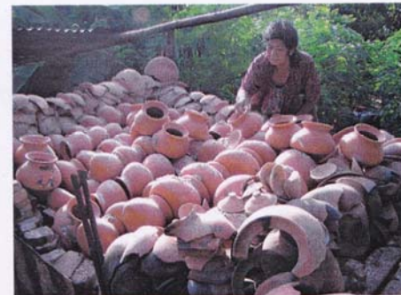
8. ทิ้งไว้ 1 คืน จึงนำหม้อดินออกจากเตา