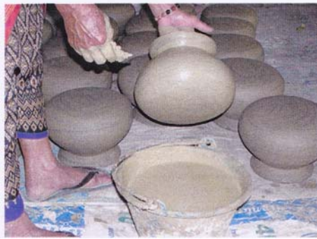
1. ทาสีด้วยดินสีเหลือง