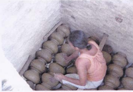
3. เรียงหม้อเป็นชั้นๆ แต่ละชั้นมี พื้นวางขนาดยาวประมาณฟุตครึ่ง