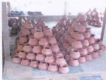
9. นำหม้อจากออกจากเตา

ภาพที่ 5 ขั้นตอนการนำหม้อดินเผาบรรจุในเตา – การเผาหม้อ