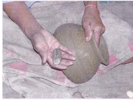
2. ขัดหม้อด้วยหินผิวมันเกลี้ยง