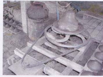
2. ช่อมอเตอร์