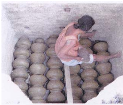
1. เรียงหม้อใส่เตา

1.4 การเผาหม้อ และการตกแต่งหลังเผาหม้อ นำหม้อที่ขัดแล้ว มาจัดเรียงเข้าเตาเผาเป็นชั้นๆ ใช้เวลาเผาทิ้งไว้ 1 คืน จากนั้นต้องการให้มีความสวยงามมากขึ้น สำหรับผลิตภัณฑ์ดินเผาขนาดใหญ่ๆ ที่ใช้สำหรับเป็นของตกแต่ง (โชว์) ให้ทาผิวหม้อด้วยน้ำข้าวชั้นๆ หรือใช้แป้งมันใส่ๆ เพื่อให้ผิวสด สวยงาม ดูสดใส เป็นมัน นี้อีกภูมิปัญญาชาวบ้านที่ทำสืบต่อกันมา แต่ปัจจุบันการทำหม้อขนาดใหญ่บางแห่งก็ไม่นิยมทำในขั้นตอนนี้ (ผิวมัน) เทคนิคนี้จึงค่อยๆ สูญหายไป รูปภาพที่ 5 ประกอบ